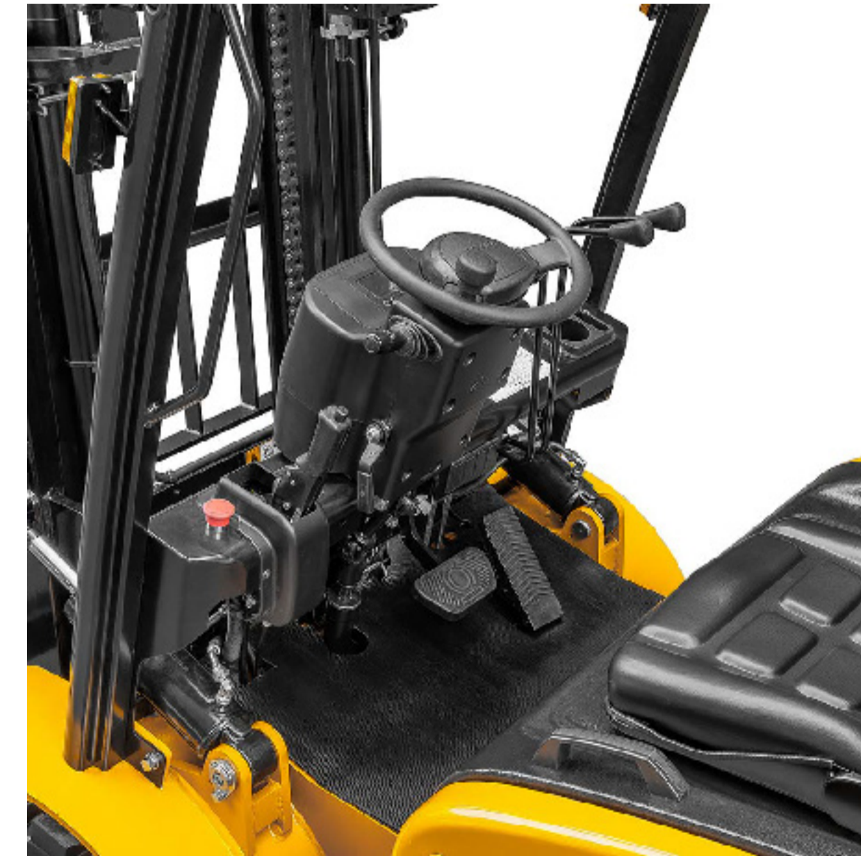
KONFORLU KULLANIM ALANI