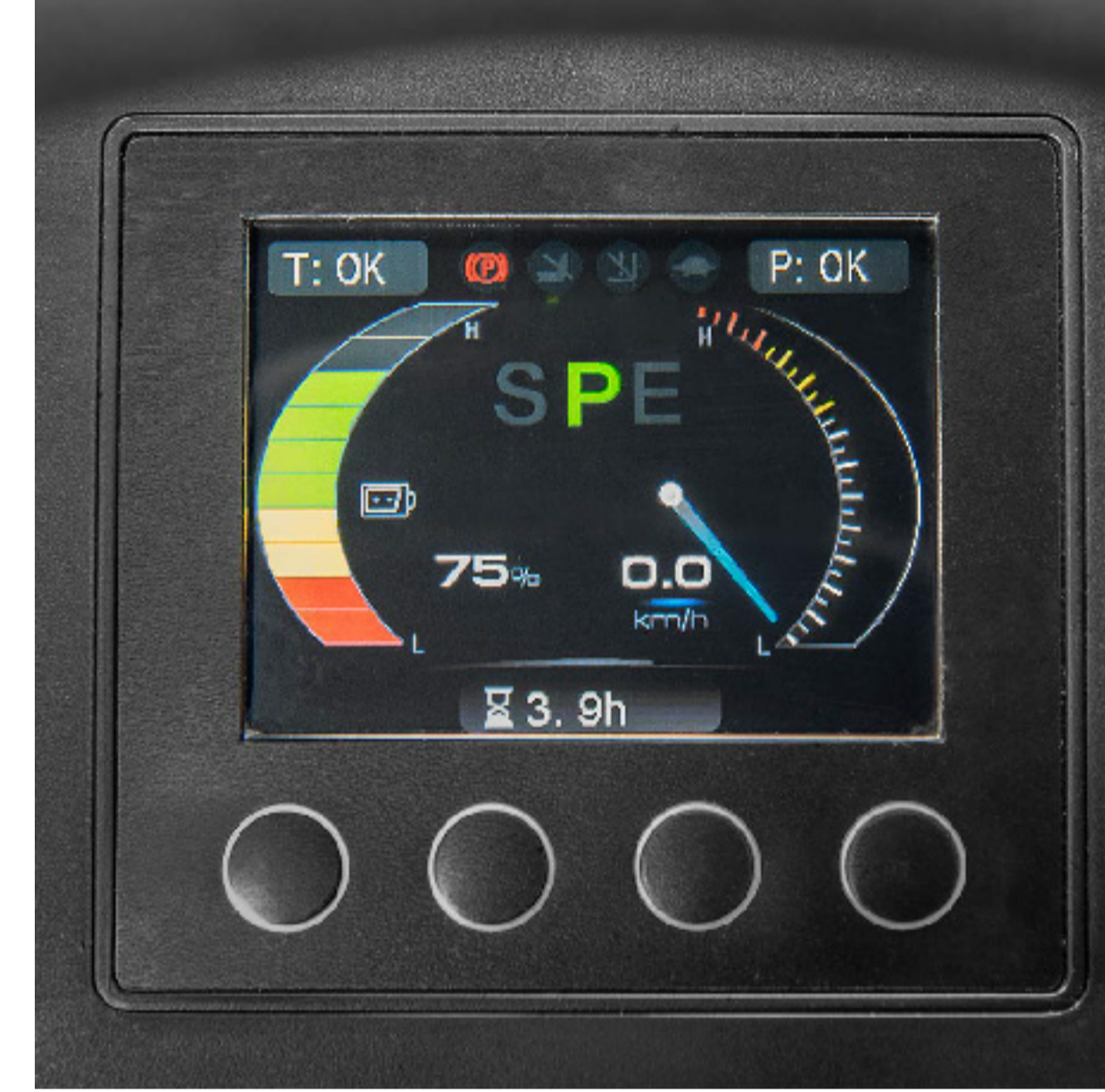
ÇOK FONKSİYONLU ZARİF RENKLİ GÖSTERGE