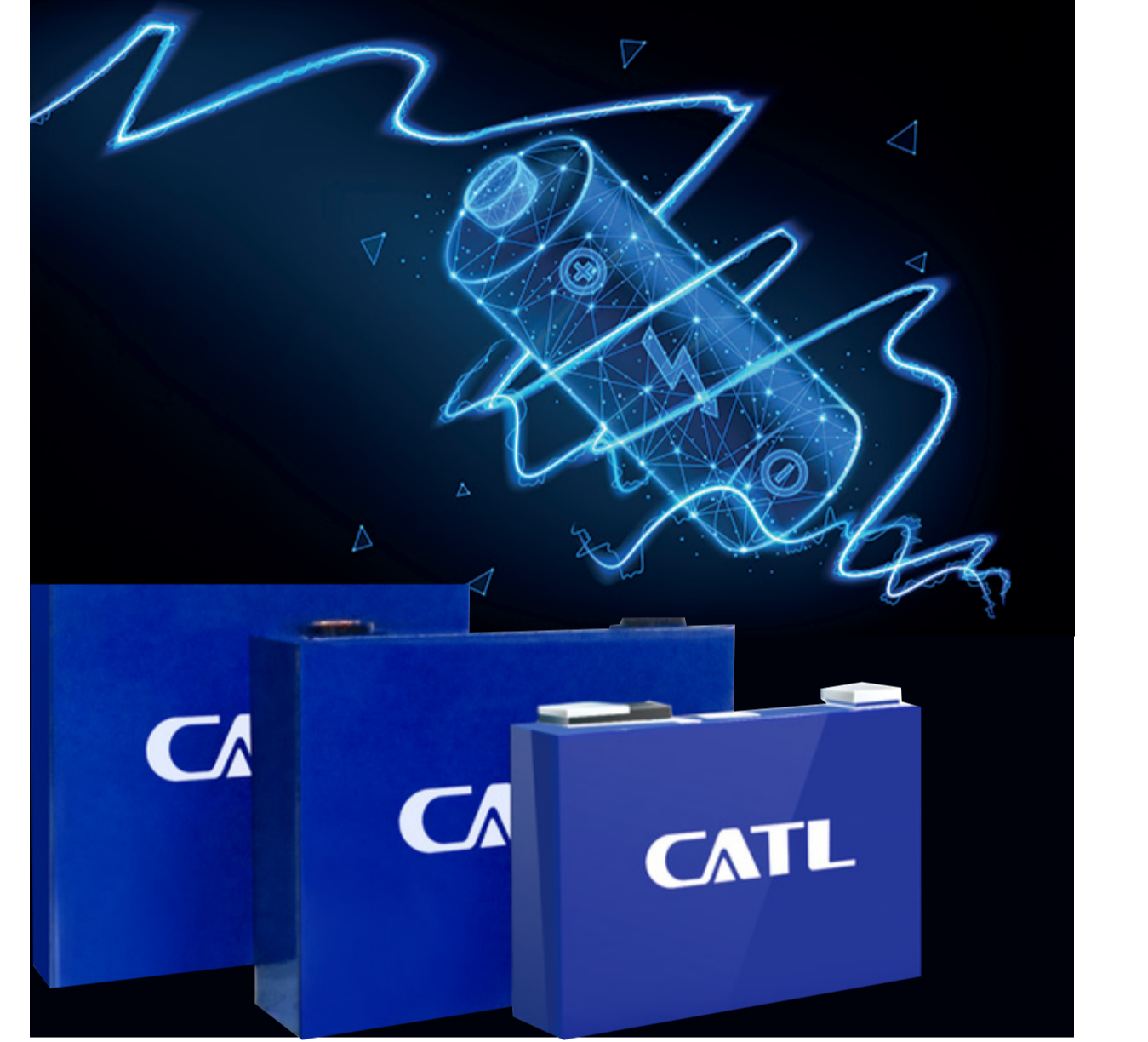
CATL MARKA AKÜ